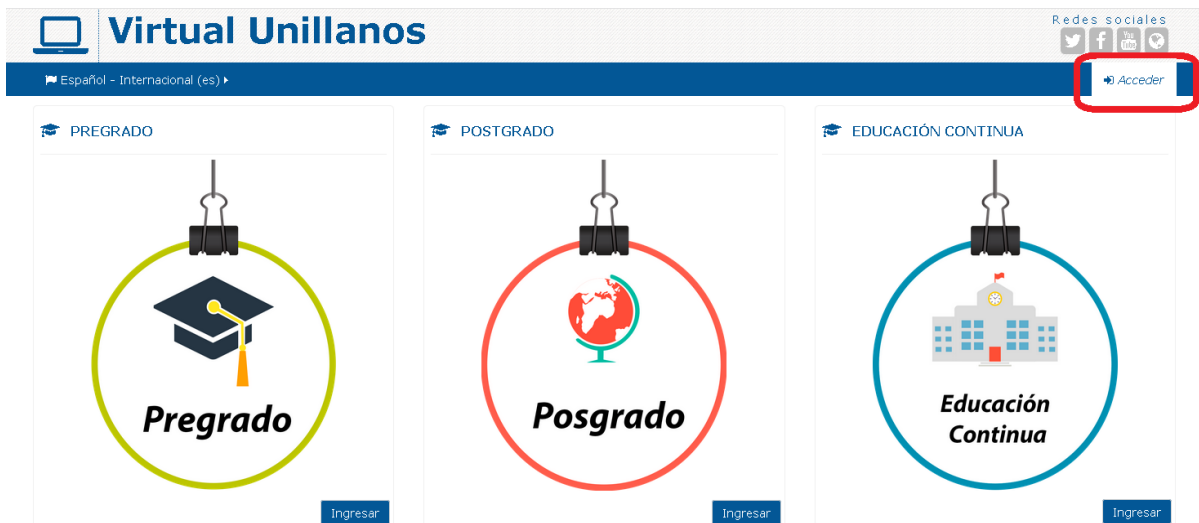
Página de inicio